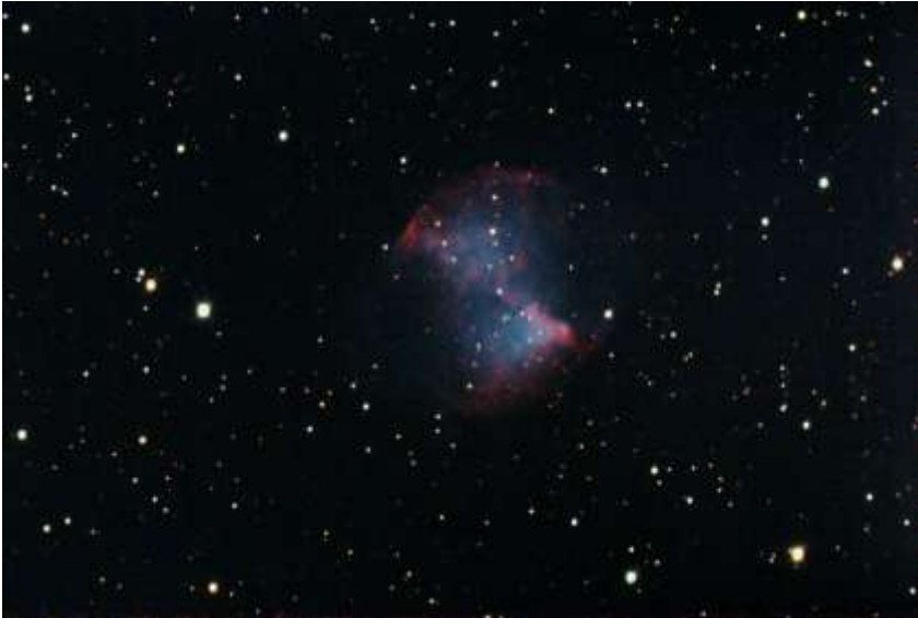
M27 7x30 sek, inga darks

T41: Forsatta test av webkamera och DSLR fotografering. Tillverkade en Hartman-mask för att förenkla fokuseringen.