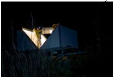
T41 by night

Fortsatt konfiguration och testning av mjukvaran. RA motorn visade sig använda fel utväxling vilket rättades till. Fokusmotorn till sekundären öppnades och vi konstaterade att en axelkoppling är trasig. Sekundären och fokusmotorn plockades bort för att fortsätta arbetet i Uppsala.